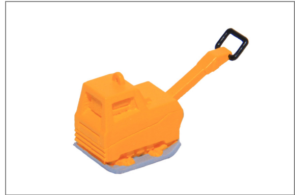
Artikel 1510 010 000-51