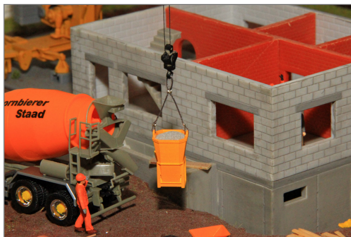
Beton-Kransilo im Einsatz auf der Baustelle.