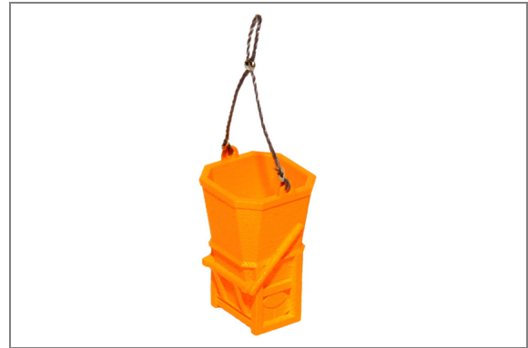
Artikel 1630 019 000-51