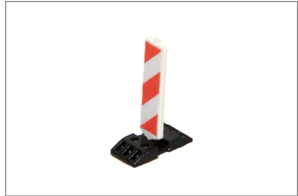
Artikel 1630 032 000-11