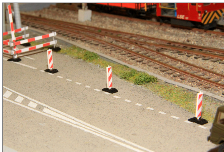
Abschrankung mit Leitbaken bei einer Baustelle