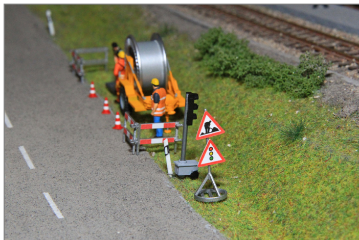
Signalisation einer Baustelle