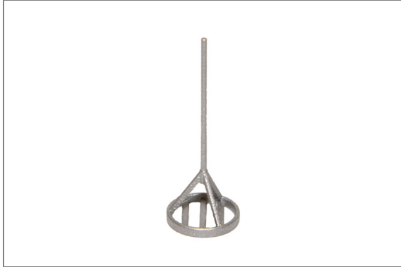
Artikel 1630 034 000-57