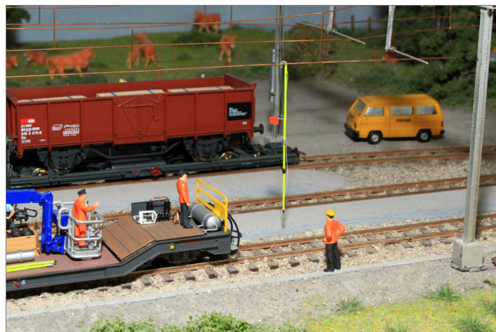
Zur Ausgestaltung der Anlage.