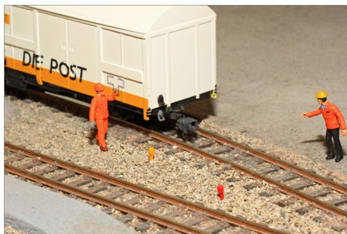
Zur Ausgestaltung der Anlage.