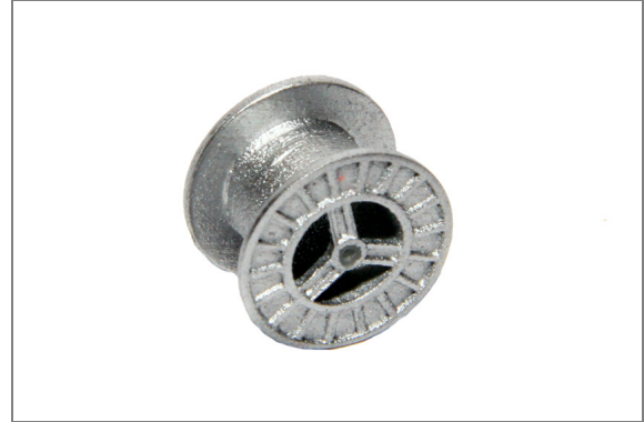
Artikel 1660 001 000-57