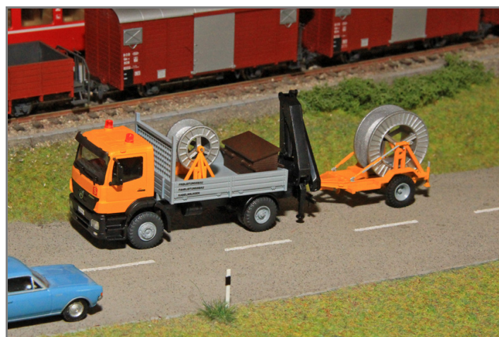
Zur Ausgestaltung der Baustelle oder als Ladegut.