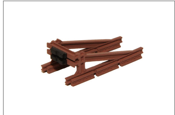
Artikel 2650 002 000