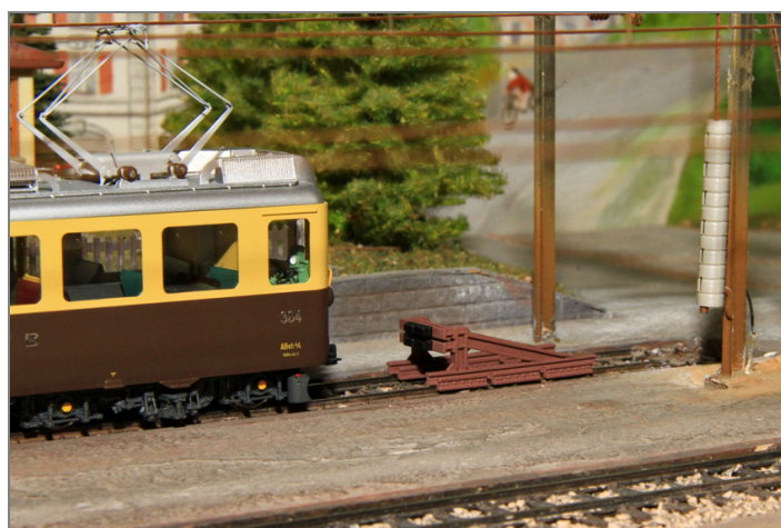
Zur Ausgestaltung der Anlage oder als Ladegut.