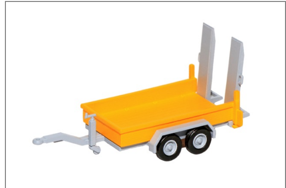
Artikel 1520 007 000-51