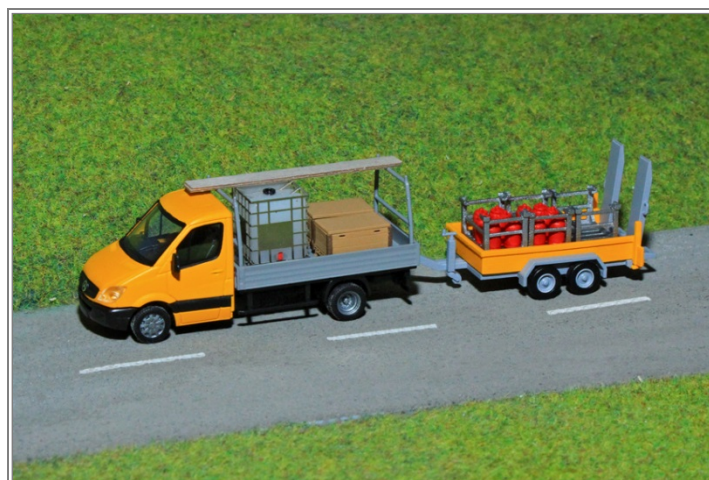
Ideal für jede Strassenszene oder Baustelle.