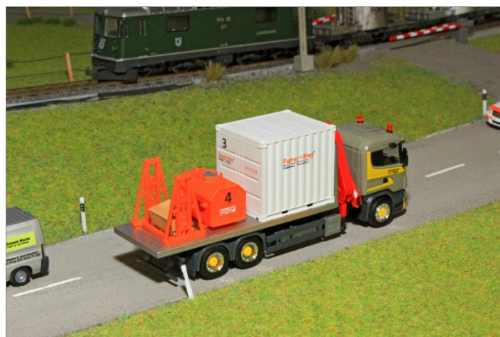
Der Materialcontainer als Ladegut auf einem Lastwagen oder auf der Baustelle.