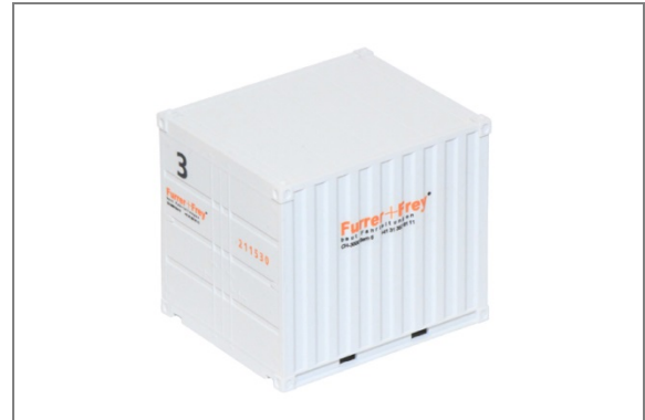
Artikel 1537 002 000-11