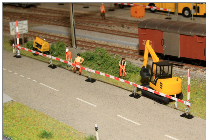
Baustellenabstrankung im Strassenbereich.