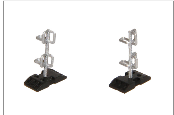
Artikel 1630 027 000-57