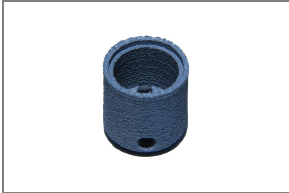
Artikel 1650 024 000-57