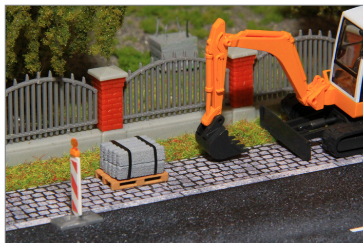
Zur Ausgestaltung der Baustelle, als Ladegut oder zum Einbau ins Diorama.