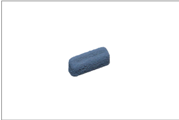
Artikel 1650 039 000-57