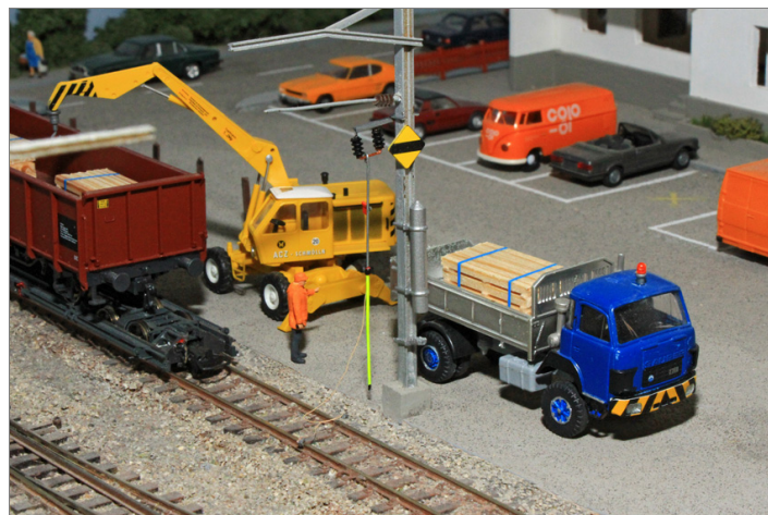
Zur Ausgestaltung der Anlage.