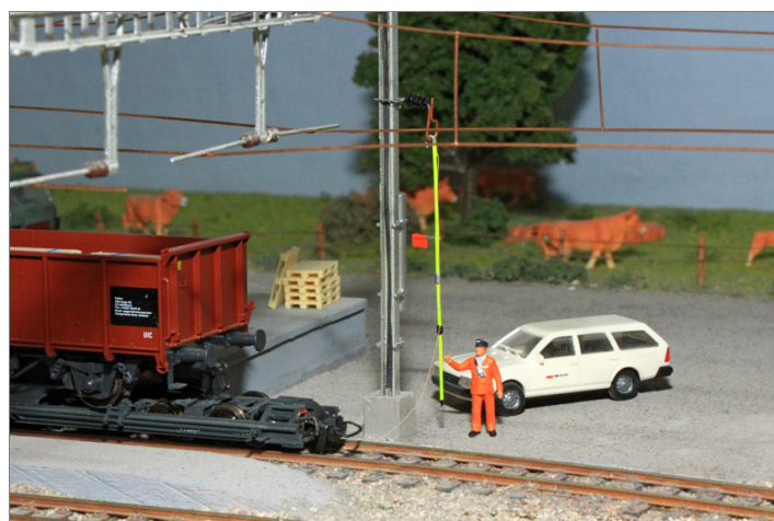
Zur Ausgestaltung der Anlage.