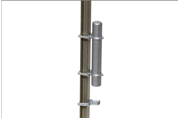
Artikel 1650 060 000-57