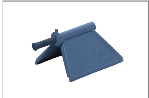
Artikel 2650 001 000-57