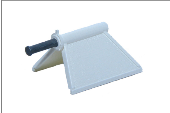
Artikel 2650 001 000-50